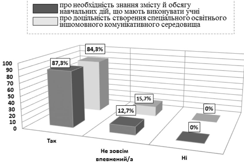
Мал. 1. Про знання змісту й обсягу навчальних дій та створення освітнього іншомовного комунікативного середовища

Цікавими, на нашу думку, виявилися результати відповідей учителів на третє запитання щодо необхідності формування в учнів 1–4 класів початкових класів предметних компетентностей (мовної, мовленнєвої, соціокультурної, загальнонавчальної) під час оволодіння ними іноземною мовою.