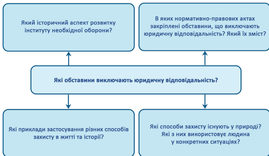
Мал. 2. Використання міжпредметних зв'язків учнів під час уроку «Обставини, що виключаються шкідливість (суспільну небезпеку) діяння»

Водночас формування цінностей потребує використання методу порівняння, який допомагає визначити переваги та недоліки способу поведінки, створити умови для вибору моделі поведінки (мал. 2).