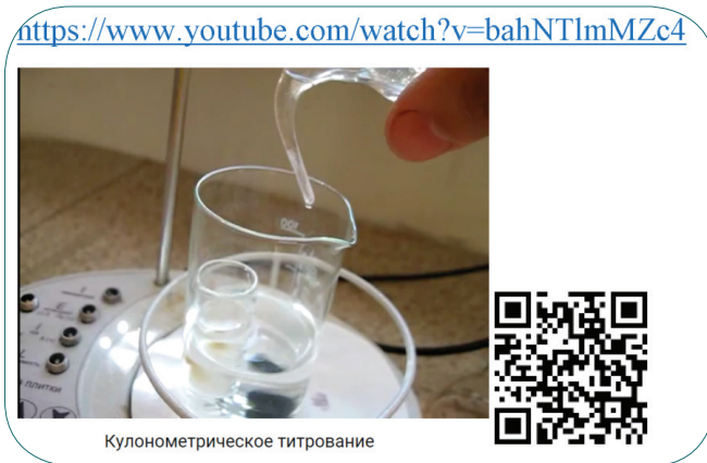
Мал. 2. Кадр з відео лекції.