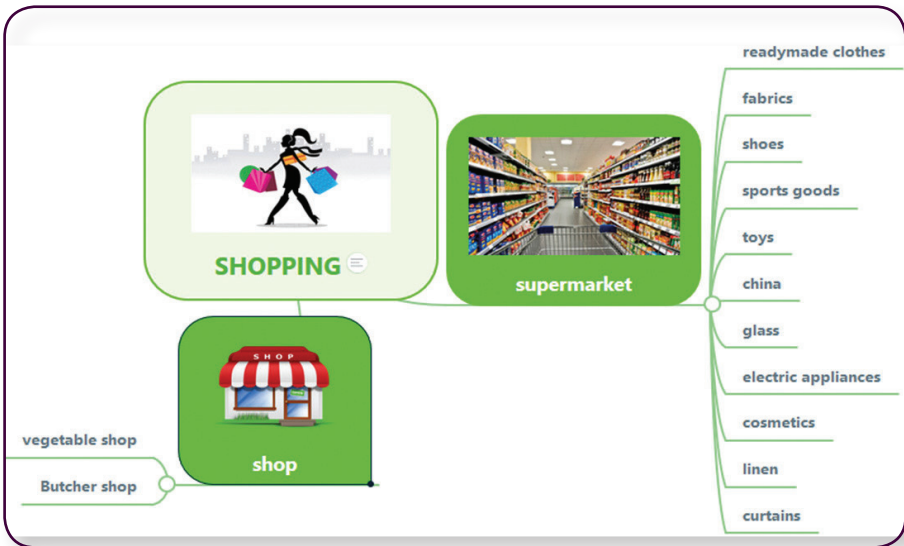
Рис. 5. Фрагмент інтелект-карти за темою «Shopping»

Так, в експерименті взяли участь 62 особи, яких було розподілено на три вікові категорії: 46–55 років; 56–65 років; від 66 років. У першій групі був 21 респондент, у другій — 20, у третій — 21. По-перше, перевірялась кількість вивчених слів, по-друге, співвіднесення малюнка та слова, по-третє, пропонувалось вставити пропущені слова у текст (перелік слів не надавався).