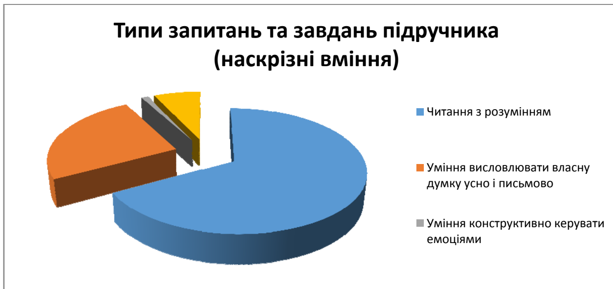
Рис. 1. Типи запитань та завдань підручника (наскрізні вміння)