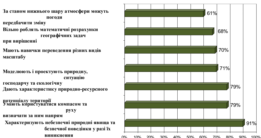
Рис. 2. Сформованість в учнів географічної компетентності практичного спрямування

Однак, як показують проведені нами моніторингові дослідження [5], учні найкраще обізнані з особливостями рідного краю саме з питань флори, фауни, природоохоронної діяльності, та значно гірше зі специфікою тектоніки, геологічної будови, рельєфу, мінеральних ресурсів, клімату, водно-ресурсного потенціалу, ґрунтового покриву, ландшафтів рідного краю, розгляду яких, у процесі вивчення географії, приділяється значно менша увага. Так, згідно з даними опитування, найкраще сформованими в учнів є саме географічні компетентності практичного спрямування (91 % респондентів) (рис. 2).