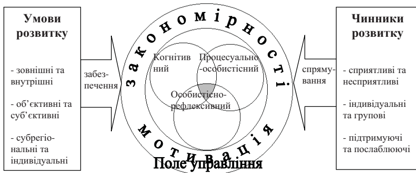
Рис. 1. Графічна схема розвитку професійної компетентності молодого вчителя

Якщо схематично об'єднати змістові компоненти професійної компетентності молодого вчителя з умовами і чинниками його розвитку, то можна отримати графічну схему розвитку професійної компетентності молодого вчителя, яка виражає структурний та організаційний взаємозв'язок зазначених понять, поданий на графічній схемі (рис. 1.)